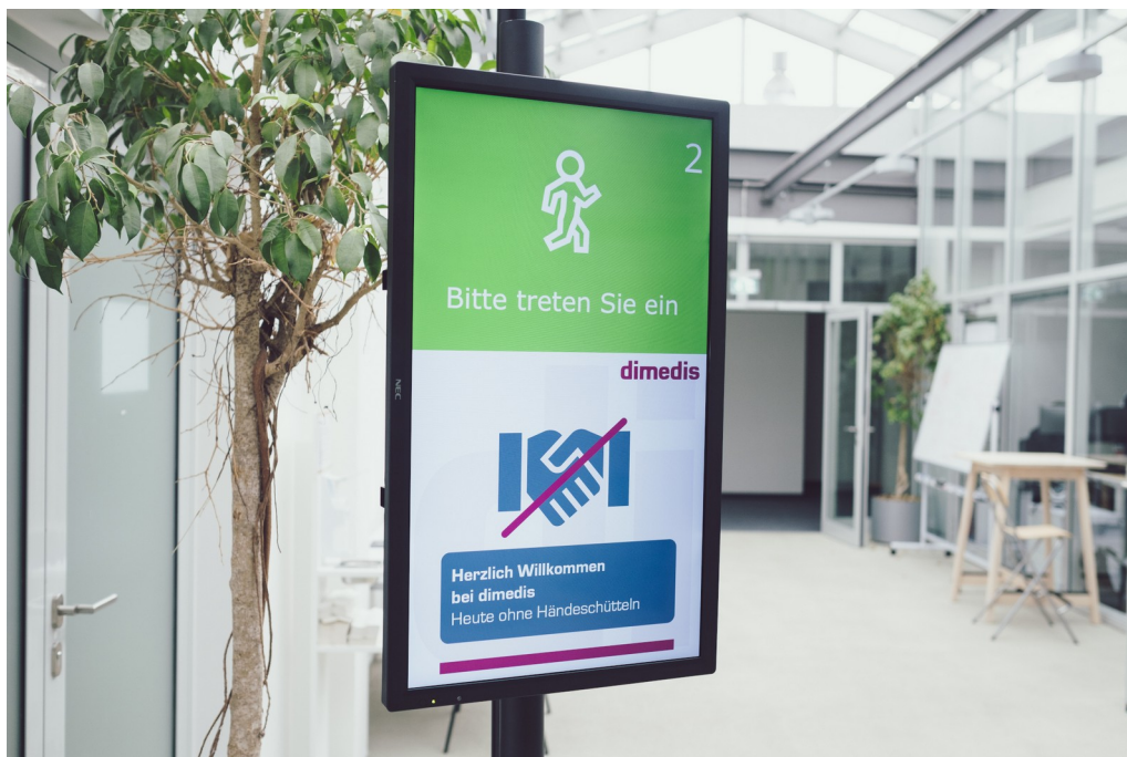
ViCo One setzt auf eine klare Kommunikation über Bildschirme.

Weitere Informationen über ViCo sind hier zu finden: www.vico-system.de